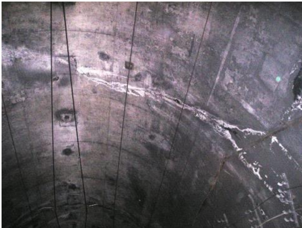
Рис.2.2 Поперечная трещина в своде, герметизированная составом КАЛЬМАТРОН. Течи и капеж отсутствуют.

На рисунке 2.1 черные пятна - увлажненная пыль в местах некачественной чеканки шва и трещин. Поступление воды здесь столь незначительное, что лишь обозначает источник увлажнением отделки, течи и капеж отсутствует.