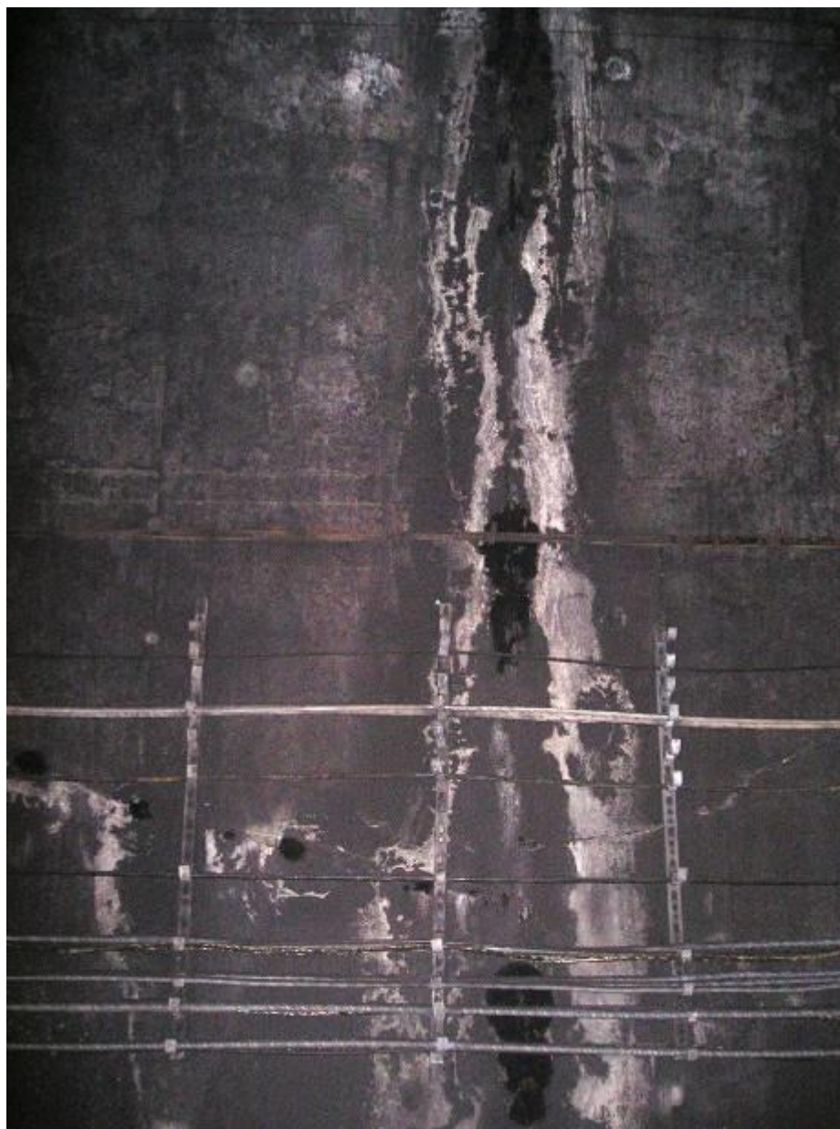
Рис. 2.1 Следы протечек из вертикального холодного шва и горизонтальных трещин, заделанных составом КАЛЬМАТРОН.

На приведенных ниже фотографиях иллюстрируется нынешнее состояние тоннельной обделки на участках с покрытием составом КАЛЬМАТРОН.