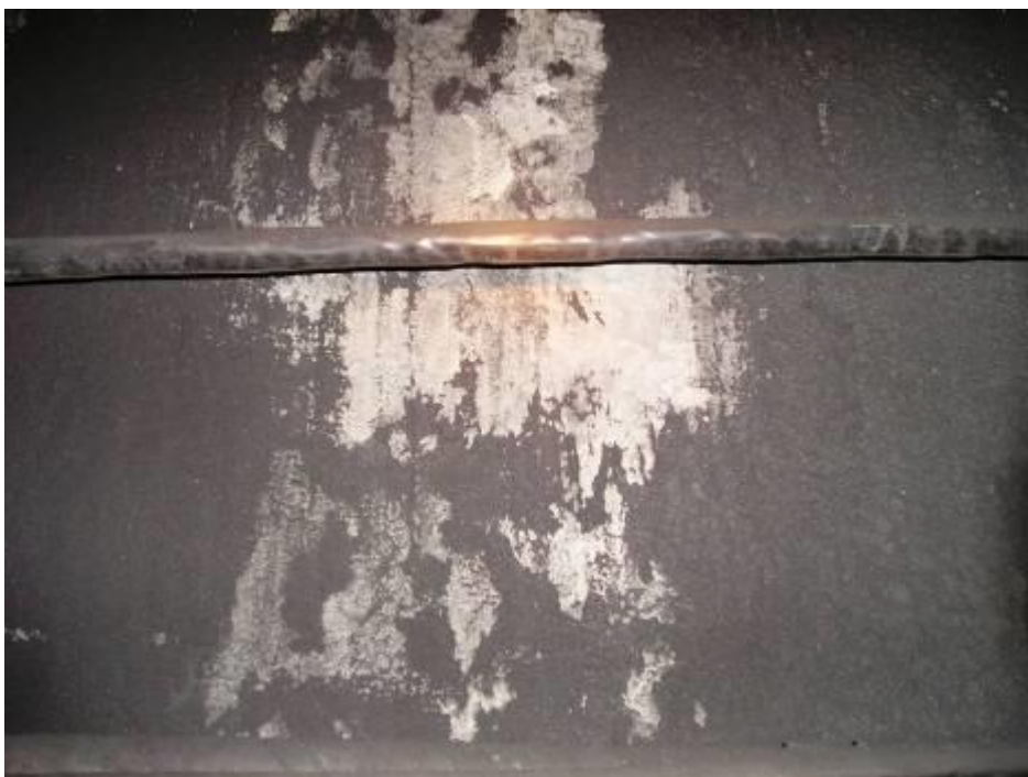
Рис. 2.5 Состояние покрытия КАЛЬМАТРОН после очистки поверхности обделки от пыли.