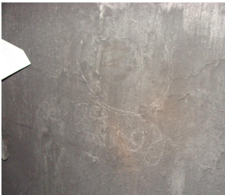
Рис. 2.6 Место испытания покрытия КАЛЬМАТРОН на прочность и водонепроницаемость в марте 2003 г. (фото от 15.11.2007 г).