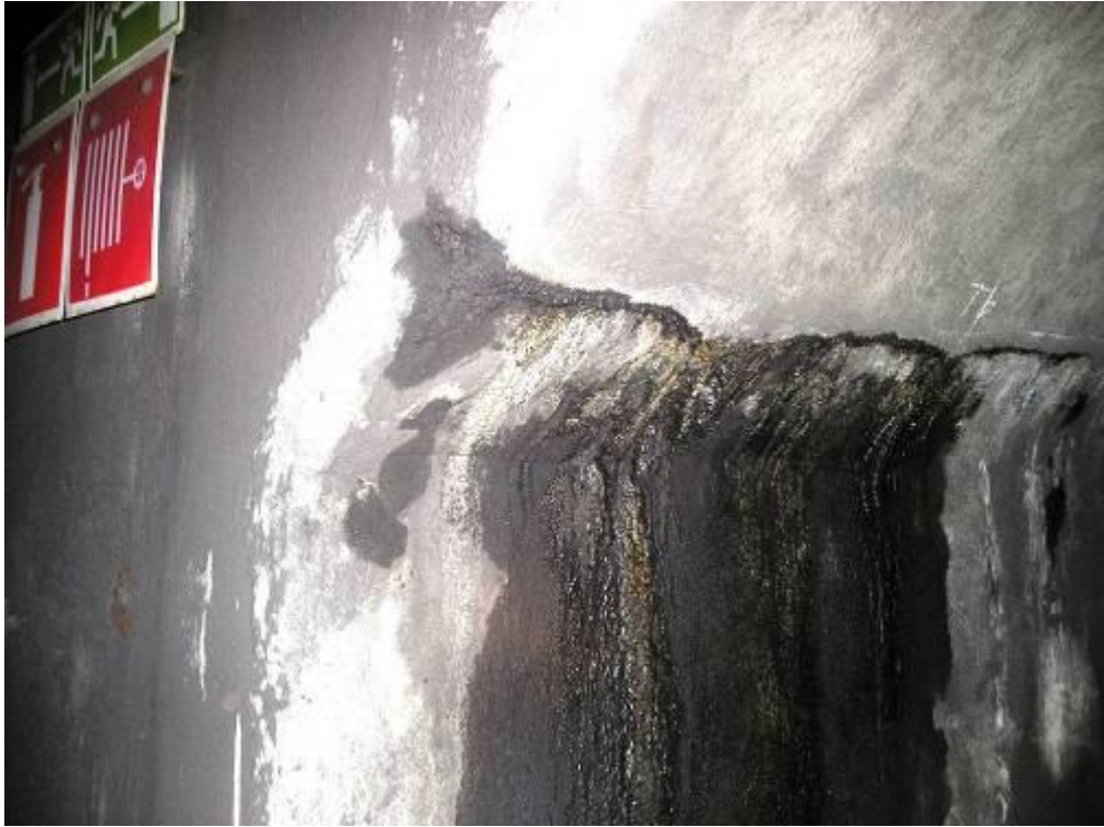
Рис. 2.3 Слабое поступление воды из поперечной трещины в основании свода ниши.